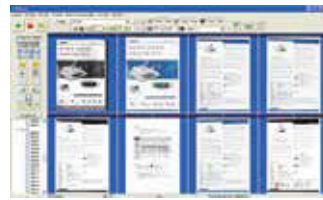
Pantalla principal de AVScan X

AVScan X -Gestión inteligente de documentos Herramienta