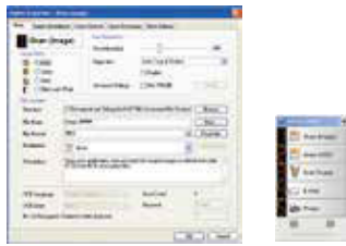
Pantalla principal de Button Manager V2

Button Manager V2 de Avison -Completa su escaneo con un paso sencillo