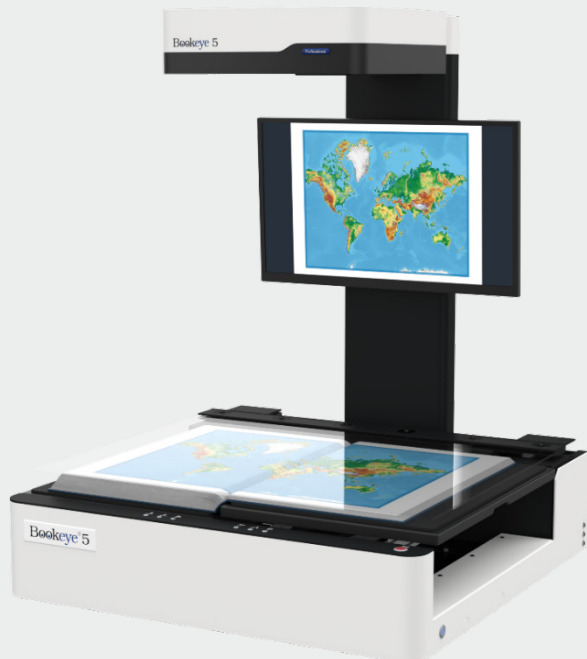
El Bookeye® 5 V1A con cuna de libros en forma de V y placa de vidrio motorizada

Antes de escanear un nuevo libro, el motor de elevación baja la placa de vidrio sobre el libro hasta alcanzar la presión deseada. La presión se mide con gran precisión, y puede llegar a ser de hasta 10kg / 22lbs bajo el control del operador. Una vez programado el grosor del libro en la mecánica de elevación, el escáner sólo tiene que abrir y cerrar el vidrio de escaneado para permitir el volteo de las páginas del libro. La placa de cristal sin bordes se abre automáticamente después de cada escaneado en el ángulo definido por el usuario. La velocidad de apertura y cierre del vidrio también es ajustable por el usuario.