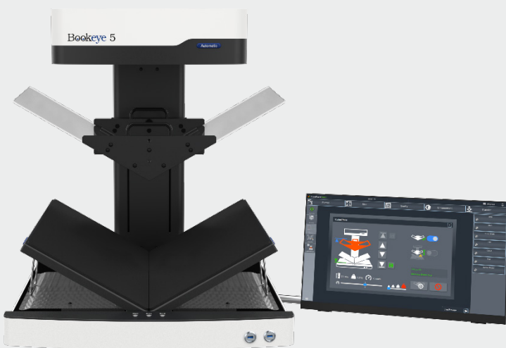
El Bookeye® 5 V2A automático con base en forma de V y placa de vidrio.

La placa de vidrio en forma de V se controla a través de la interfaz de usuario extendida de ScanWizard. El nuevo panel de control con botones de función animada permite, entre otras cosas, el movimiento horizontal hacia arriba y hacia abajo, ajustando la velocidad o la posición en la que permanece la placa de vidrio después del trabajo de escaneo terminado. No necesariamente tiene que estar en la parte superior o inferior. Dependiendo de los requisitos, la placa de vidrio se puede quitar y volver a colocar sin herramientas y en dos simples pasos.