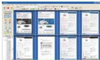
Pantalla principal de AVScan X

-La herramienta inteligente de manejo de documentos