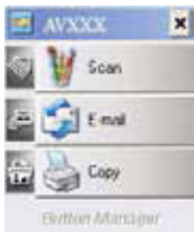
The Button Panel

1. Después de que el Button Manager y el reproductor del escáner han sido instalados correctamente en tu computadora, el Button Panel se mostrara en el Windows System. Bandeja en la parte inferior derecha esquina de la pantalla del ordenador.