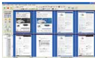
The AvScan 5.0 main screen

-La Herramienta de Administración de Documentos Inteligente