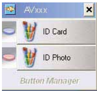
The Button Panel

1. Después del Button Manager y el controlador de escáner han sido instalados con éxito en tu computadora, el Button Panel se mostrara en el Windows System Tray en la esquina inferior derecha de la pantalla del ordenador.