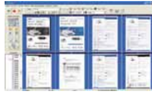
The AvScan 5.0 main screen

-El Administrador de Documentos Inteligente