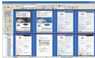
The AvScan 5.0 main screen

La herramienta inteligente de administración de documentos.