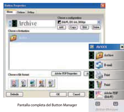
Pantalla completa del Button Manager

El Button Manager, software de vanguardia, nos permite llevar a cabo tareas de escaneo en un solo paso. Cuando presionamos el botón, automáticamente se escanean los documentos y se convierten en formatos altamente comprimidos, en documentos con opción de búsqueda en Adobe PDF, ó otros formatos de imágenes, y después se mandan al formato ó aplicación destinada tal como correo electrónico, impresora, ó la aplicación de su deseo. El convencional largo proceso de escaneo es ahora sustituto por un solo botón, un solo paso!