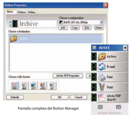
Pantalla completa del Button Manager

El Button Manager, software de vanguardia, nos permite llevar a cabo tareas de escaneo en un solo paso. Cuando presionamos el botón, automáticamente se escanean los documentos y se convierten en formatos altamente comprimidos, en documentos con opción de búsqueda en Abode PDF, ó otros formatos de imágenes, y después se mandan al formato ó aplicación destinada tal como correo electrónico, impresora, ó la aplicación de su deseo. El convencional largo proceso de escaneo es ahora sustituto por un solo botón, un solo paso!