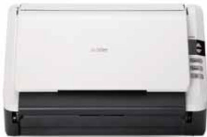
Bandeja de entrada y salida de papel plegable cuando no se usa.

Escaneo simple y rápido con solo presionar un botón