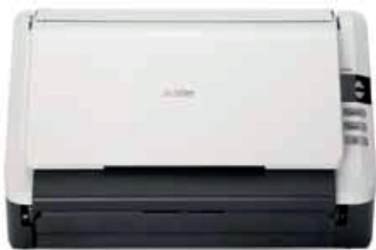
Bandeja de entrada y salida de papel plegable cuando no se usa.

Escaneo simple y rápido con solo presionar un botón